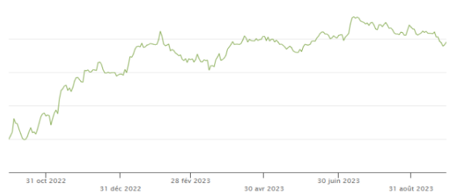
Évolution des « Multiples de valorisation en non coté »